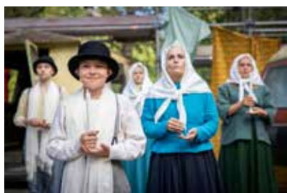
▲ Pressbilder från sommaren 2024.